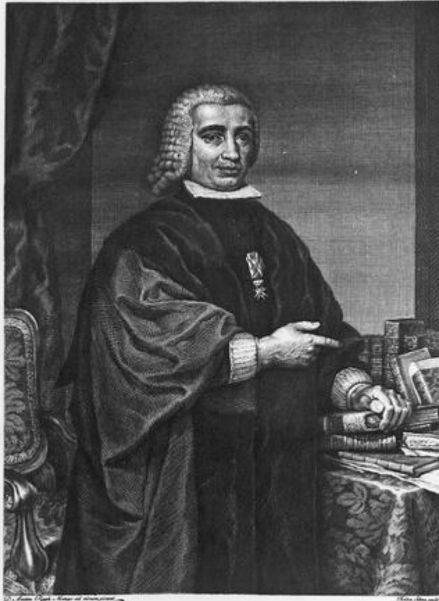
El Conde de Campomànes.

Rechteinformation und weitere Details zur Aufnahme